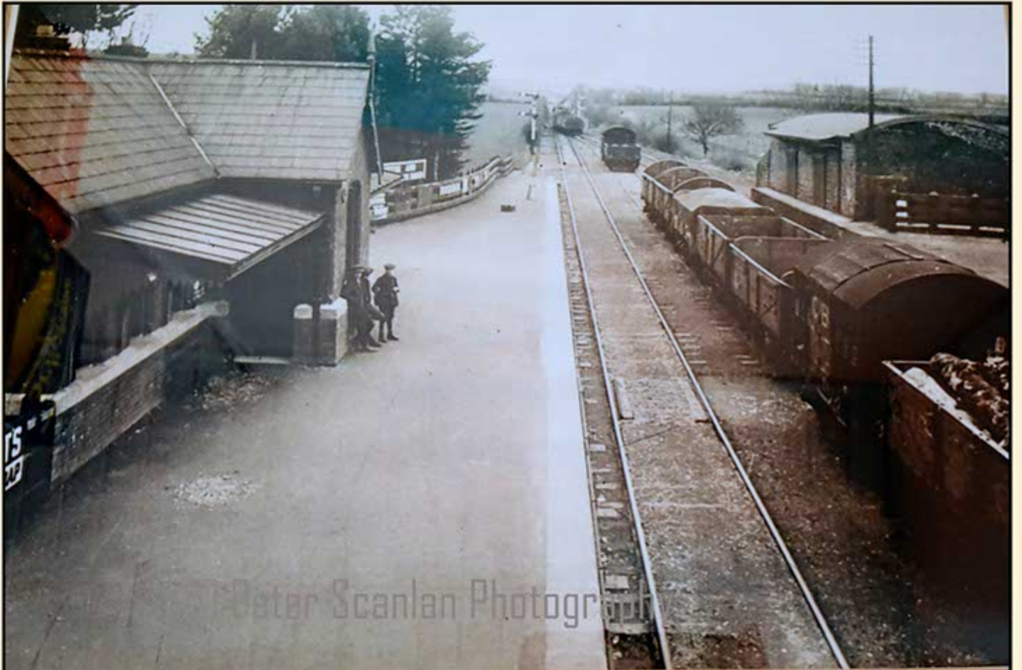
Upton Station 1920